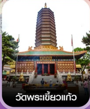
วัดพระเขี้ยวแก้ว