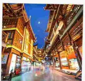
ตลาดเดินหัวงเมี่ยว