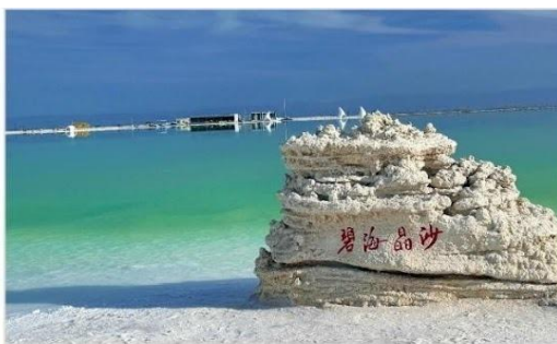
ทะเลสาบเกลือจาเอ๋อฮั่น (Chaerhan Salt Lake)