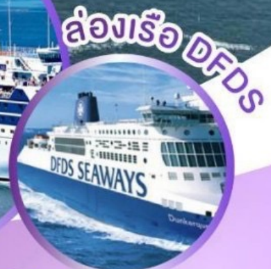
ล่องเรือ DFDS

23-31 ส.ค. 6-14, 16-24, 20-28 ก.ย. 27 ก.ย.-5 ต.ค. 4-12, 11-19, 18-26 ต.ค. 21-29, 25 ต.ค.-2 พ.ย.