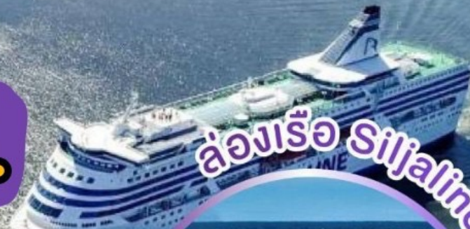
ล่องเรือ Siljaline

ล่องเรือและพักบนเรือสำราญ SILJALINE ล่องเรือและพักบนเรือสำราญ DFDS SEAWAY มีบินภายในไม่ต้องนั่งรถไกล