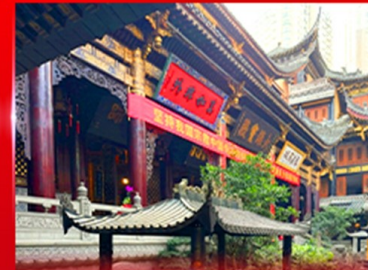
วอพรวัดหลัวฉิน ฉงชิ่ง