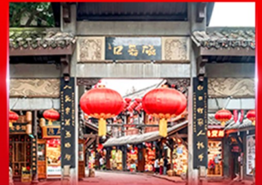
หมู่บ้านโบราณฉิวซีฟัว