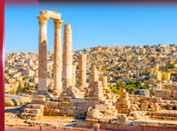
บิอัมปราการธัมมาน