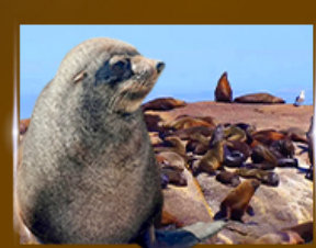
ส่องเรือชมฝูงแมวน้ำ Seal Island