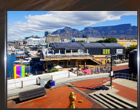
ท่าเรือ V&A waterfront