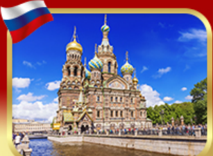
เข็ควินโบสกแห่งหอยดลือด