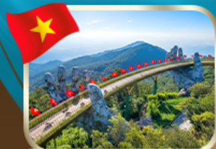
เที่ยวสะพานมังกรทองคำ บานาฮิลล์