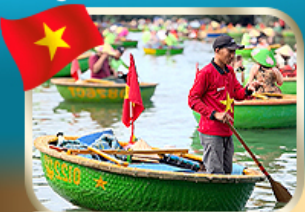
ล่องเรือกระด้ง ชมหมู่บ้านก๊วกทาน