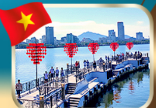
เช็คอินสะพานแห่งความรัก ดานัง