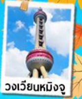
วงเวียนหมิงจู่