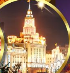
เดอะมันด์