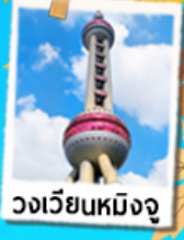
วงเวียนหมิงจู่