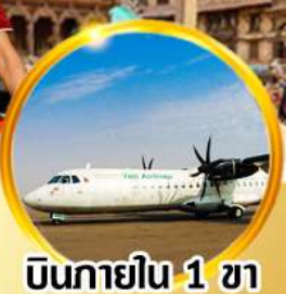
บินภายใน 1 ขา