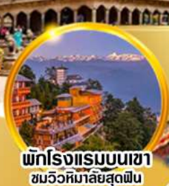
พักโรงแรมบนเขา ชมวิวหิมาลัยสุดฟิน