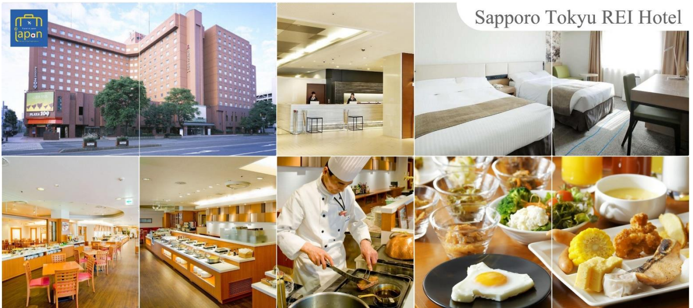
Sapporo Tokyu Rei Hotel

รับประทานอาหารเย็น ณ ภัตตาคาร (7) --- พิเศษ!!! เมนู ชาบู + ชาปู SAPPORO TOKYU REI HOTEL หรือเทียบเท่าระดับเดียวกัน