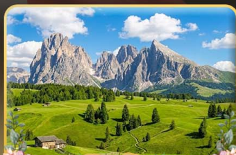
ชมวิวดังการ alpe di siusi