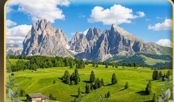
ชมวิวลังการ alpe di siusi