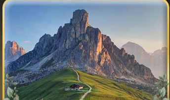
เยือน Passo Giau