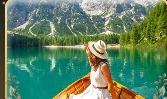
พายเรือทะเลสาบ Braies