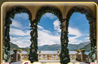
เชคอิน Villa del Balbianello

ที่สุดของธรรมชาติแห่งอิตาลี ทิวเขา ทะเลสาบ ความงามแห่งโดโลไมท์