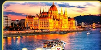
ส่องเรือแม่น้ำดานูบ ช่วง Twilight