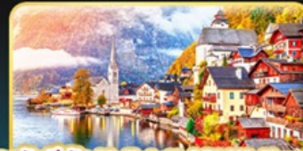
การันตีพัก Hallstatt / St. Wolfgang หรือริมนทะเลสาบ 1 คืน