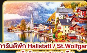
การ์นต์พัก Hallstatt / St. Wolfgang หรือริมทะเลสาบ 1 คืน