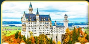
เข้าชมปราสาทนอยชวานสไตน์

คัดสรรความเป็น "ที่สุด" ของยุโรปตะวันออกครบถ้วน