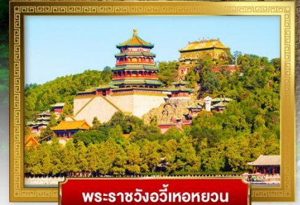
พระราชวังอู่เหอหยวน