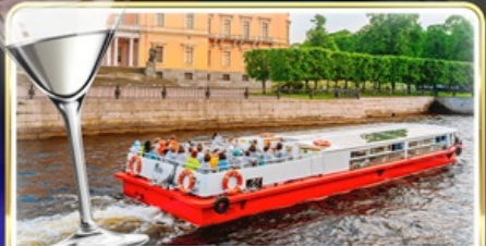
ล่องเรือแม่น้ำแคว พร้อมเสิร์ฟ Vodka Tasting