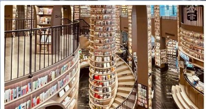
ร้านหนังสือจางชู่เก๋อ