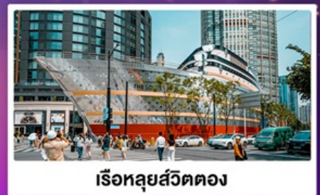
เรือทูลุยส์วัดตอง