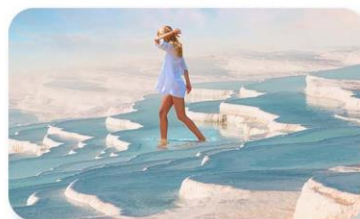
ปราสาทปูยีฝาย