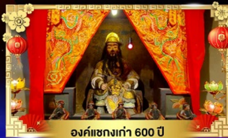
องค์แซงเก่า 600 ปี