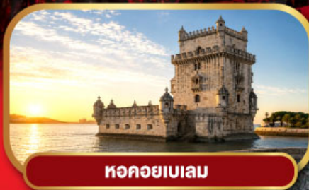
หอคอยเบเลม

ขึ้นกระเช้าไฟฟ้า อารามมอนต์เซอริต กับตำนาน Black Madonna