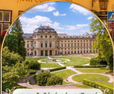
พระราชวังเวิร์ทชบวร์ค เรสซิเดนซ์