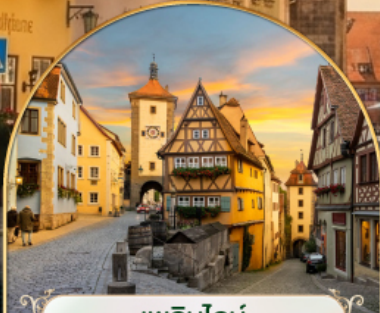
เวลินไลน์