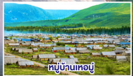
หมู่บ้านเหม่อู