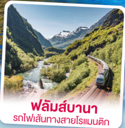
ฟลิมส์บานา รถไฟเส้นทางสายโรแมนติก