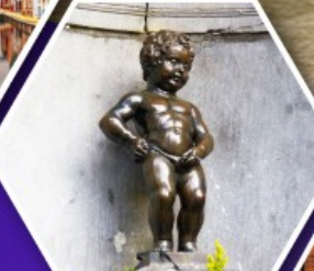
แมนเกินฟิส