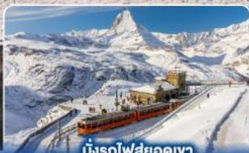
นั่งรถไฟสู่ยอดเขา กรอนเนอร์เกรต