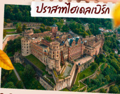
ปราสาทไฮเดคเบิร์ก