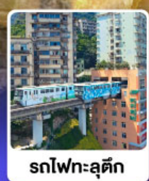
รถไฟทะเลตึก