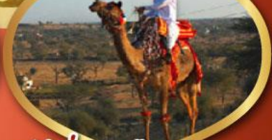
ฟรี ขี่อูฐ เมืองมันทอวา ราคาเริ่มต้น