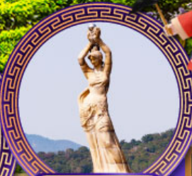
จูไห่พิงเซอร์กิส