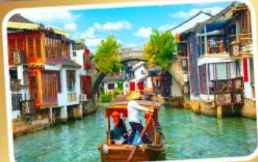
ล่องเรือเมืองโบราณซูเจียเจียว