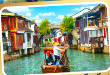
ล่องเรือเมืองโบราณจูเจียเจียว