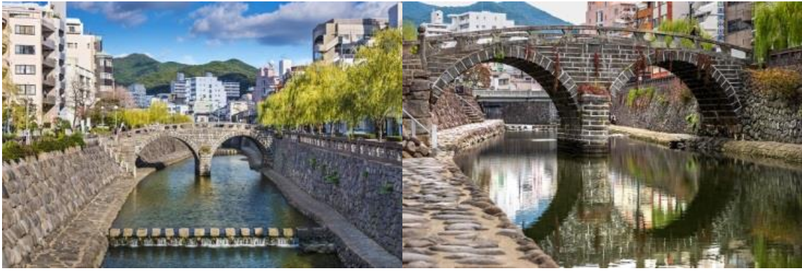
สะพานเมกานะบาชิ (Meganebashi Bridge)

ท่านสามารถลงไปที่เที่ยวอิสระตามอัธยาศัย หรือ ซื้อทัวร์เสริมของเรือที่ให้บริการอยู่ได้ ควรซื้อทัวร์เสริมของทางเรือก่อนจะถึงจุดหมายที่ท่านต้องการ 1 วันเดินทาง