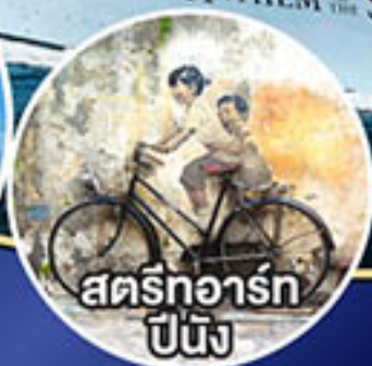
สตรีทอาร์ต ปีนัง