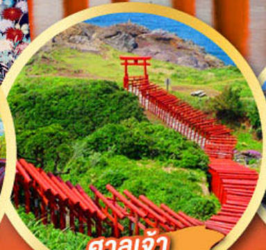
ศาลเจ้า โมโตโนะซุมิ อินาริ