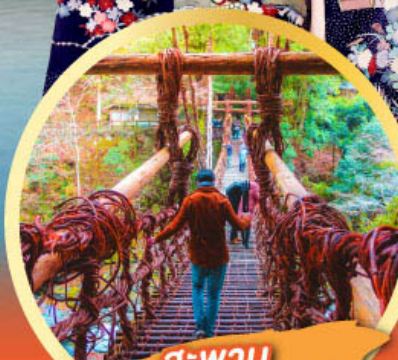
สะพาน อียะโนคะชิระปะชิ