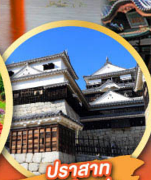
ปราสาท มัตสึยาม่า