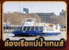
สองเรือแม่น้ำเทมส์