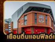
เยือนต้นแอนฟิลด์และโอลด์แทรฟฟอร์ด

London Stonehenge Liverpool Manchester Stratford Upon Avon