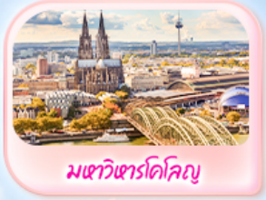
มทาวินทาร์โคโลญ