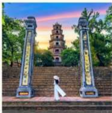
วัดเทียนมู่