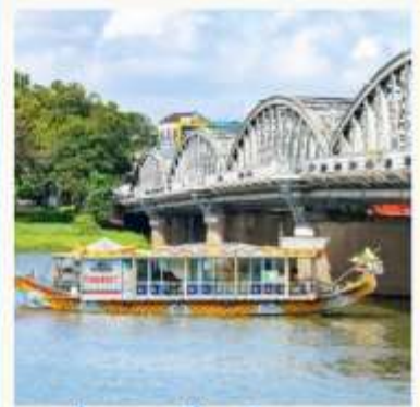
ล่องเรือมังกร แม่น้ำหอม