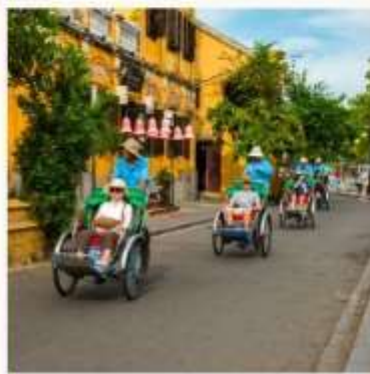
นั่งสามล้อชมเมือง