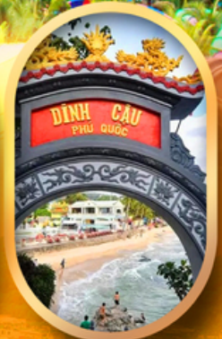
ศาลเจ้าดิงเกา