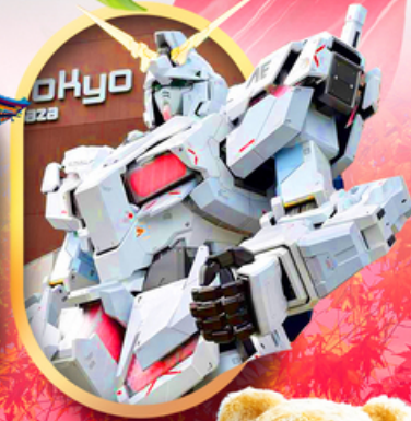
ห้างไอโดบะกันดั้ม