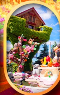
สวนเทพเจ้า