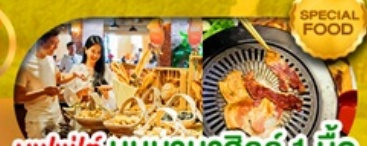
บุฟเฟ่ต์บนบานาฮิลล์ 1 มื้อ และ บุฟเฟ่ต์ บาบิวบั้งย่าง เดินทาง มี.ค. - ต.ค. 69