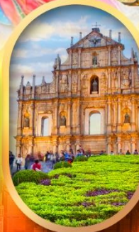
โบสถ์เซ็นต์พอล