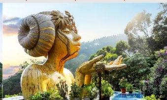
โทว เมย คาเฟ่