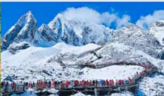
ภูเขาหิมะมิงกรหยก