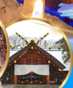
ศาลเจ้า ออกโทโต

เดินทาง 04 - 09 กุมภาพันธ์ 68 05 - 10 กุมภาพันธ์ 68 06 - 11 กุมภาพันธ์ 68