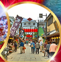
ย่านโบราณ ชิบูมาตะ