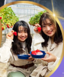
บุฟเฟต์ สดอเบอร์รี่ เก็บสดจากต้น

ราคา เดียว 45,919 บาท รวมภาษีมูลค่าเพิ่ม 7%