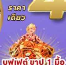
บุฟเฟต์ ซาปู 1 มื้อ