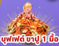
บุฟเฟต์ ชาปู 1 มือ

ราคา เดียว 45,919 บาท รวมภาษีมูลค่าเพิ่ม 7%