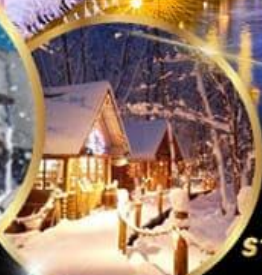
หมู่บ้านเทพนิยาย นิงเกิลเทอเรส