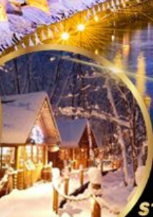
หมู่บ้านเทพนิยาย นิงเกิลเทอเรส