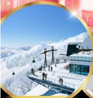
จุดชมวิวก Unkai Terrace