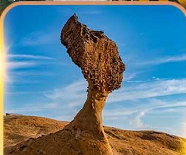
อุทยานเหยหลิว