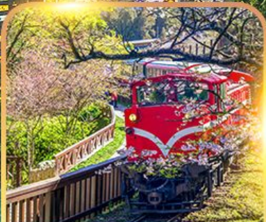
อุทยานอาหลี่ซาน

เที่ยวครบ 4 อุทยาน !! อาหลี่ซาน - ไถ่ฝิงซาน - เหยหลิว - ทาโรโกะ