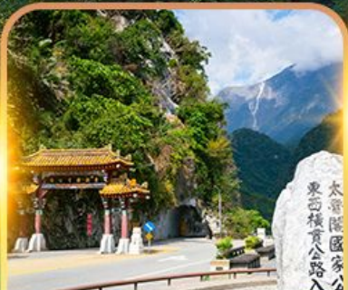
อุทยานทาโรโกะ(ด้านหน้า)