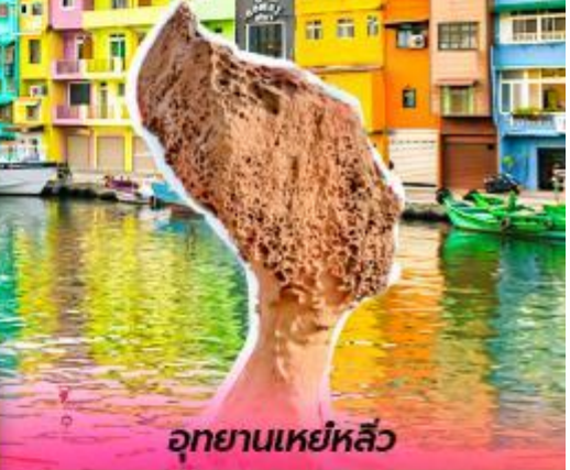
อุทยานเหย์หลิว